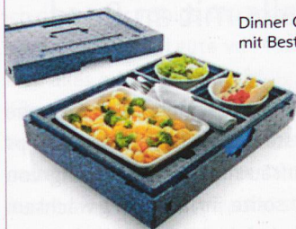
Dinner Champion II mit Besteckfach

Aussengrösse: 43.0 x 32.5 x 11.5 (L/B/H) Anzahl: 109 blaue Boxen und 18 schwarze Boxen Preis: CHF 40.00/Stück, Preis verhandelbar (Neupreis CHF 98.–)