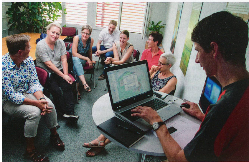
Am Workshop werden die Ergebnisse der Standort- und Gebietsanalyse diskutiert.

Neue Ballungsräume, mehr Einwohner, mehr Verkehr: Spitex-Organisationen müssen frühzeitig auf Veränderungen in ihrer Region reagieren. Eine Standort- und Gebietsanalyse kann helfen, die richtigen Entscheidungen zu treffen. Dazu braucht es viele Daten, eine kluge Software und einen konstruktiven Workshop zum Ideenaustausch.