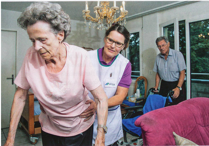
Nicht jede wahrgenommene Schutzbedürftigkeit führt zu einer Gefährdungsmeldung.

Spitex-Fachpersonen können mittels Gefährdungsmeldungen die Kindes- und Erwachsenenschutzbehörde (KESB) auf die Schutzbedürftigkeit von Klientinnen und Klienten aufmerksam machen. Eine Studie der Fachhochschule Nordwestschweiz untersuchte nun die Frage, welche Fachpersonen was melden und warum (nicht)?