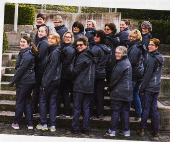
Mitarbeiterinnen der SpiteX AachThurLand präsentieren ihre neue Arbeitskleidung, die auch auf dem Arbeitsweg schützt.