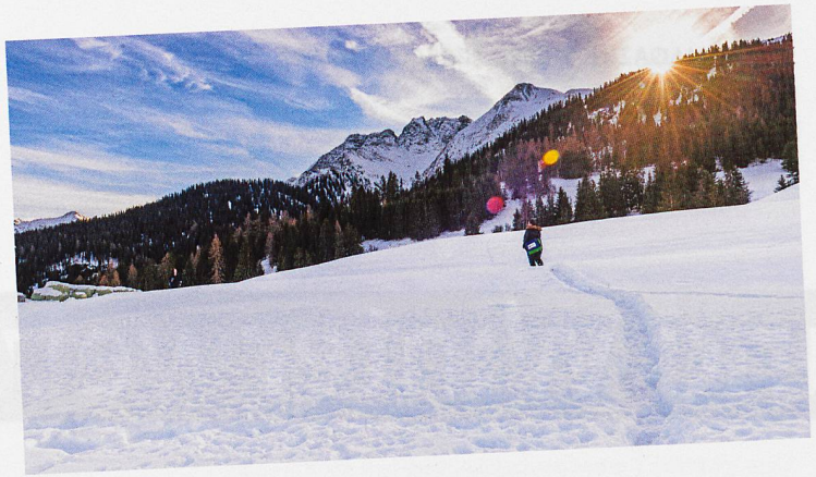
Diana Lago, Mitarbeiterin der Spitex Foppa, mag das Unterwegssein im tief verschneiten Bündnerland.

Die Spitex Foppa benötigt bis zu 40 Minuten, um zu