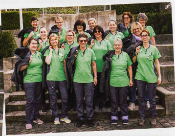
*Die Zahlen dienen jeweils der Veranschaulichung des Beispiels. Da die Daten unterschiedlich erhoben und interpretiert wurden, macht der direkte Vergleich zwischen den Beispielen nicht immer Sinn.