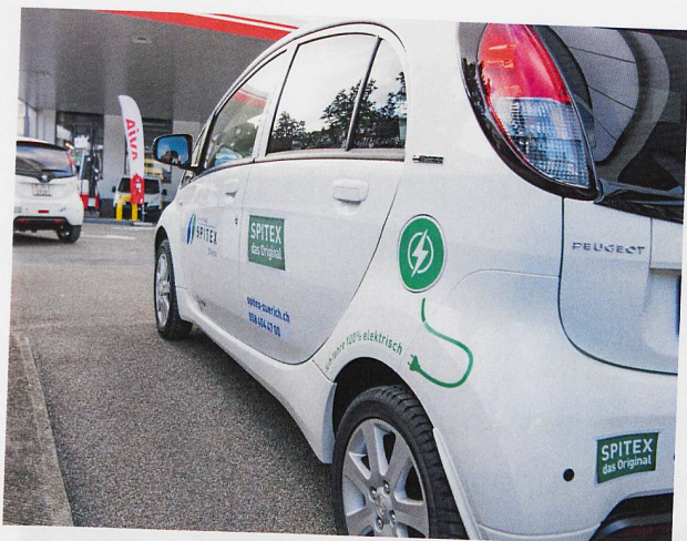
Elektrofahrzeuge, hier eines der Spitex Zürich, sind bei der Spitex auf dem Vormarsch.

Wyrsh, als Spitex Nidwalden im Dezember 2019 drei Elektroroller im Empfang nahm. «Zudem sind Elektroroller zum Beispiel wartungsfreundlicher als herkömmliche Roller, wodurch unsere Betriebskosten tiefer ausfallen», ergänzte er. Schliesslich sind die Roller auch hinsichtlich der derzeit 20 Auszubildenden bei Spitex Nidwalden wichtig. Rund die Hälfte dieser Nachwuchskräfte ist nämlich unter 18 Jahre alt und darf daher (noch) kein Auto lenken. Die Roller dürfen ab 16 Jahren gesteuert werden. Und sie bringen ihre jungen Fahrerinnen und Fahrer in Windeseile zu ihren Klientinnen und Klienten, selbst wenn diese in abgelegenen Bergdörfern zu Hause sind.