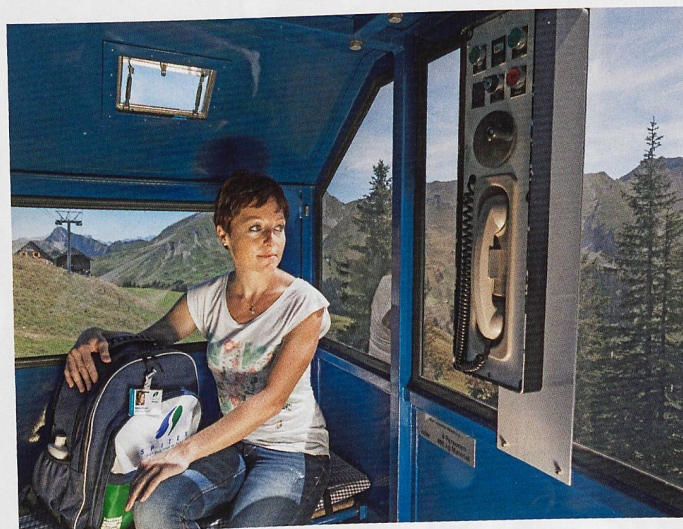
Die Mitarbeitenden von Spitex Nidwalden sind täglich mit Luftseilbahnen unterwegs.