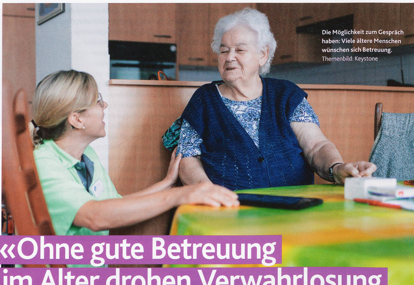
Die Möglichkeit zum Gespräch haben: Viele ältere Menschen wünschen sich Betreuung.