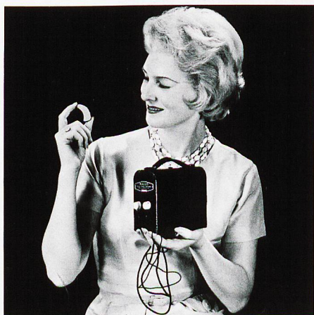
Ein Blick zurück: Hörgeräte aus früheren Tagen.

«Die neuesten Geräte stellen sich innert Millisekunden vollautomatisch auf die jeweilige