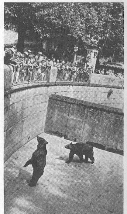
Unsere jungen «Home»-Gäste beim Bärengraben in Bern. – Nos jeunes hôtes du «Home» à la Fosse aux ours à Berne.