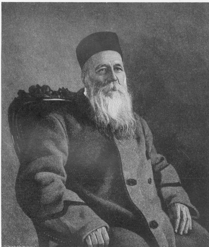
Henri Dunant 1828 – 1910 Gründer des Roten Kreuzes

Zum 25jährigen Regierungs- Jubiläum S. D. Fürst Franz Josef II. von und zu Liechtenstein