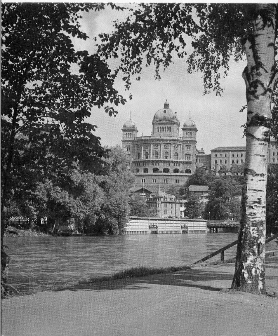
Bern / Bundeshaus

Redaktion und Administration: Schweizer-Verein im Fürstentum Liechtenstein, Postfach, Vaduz