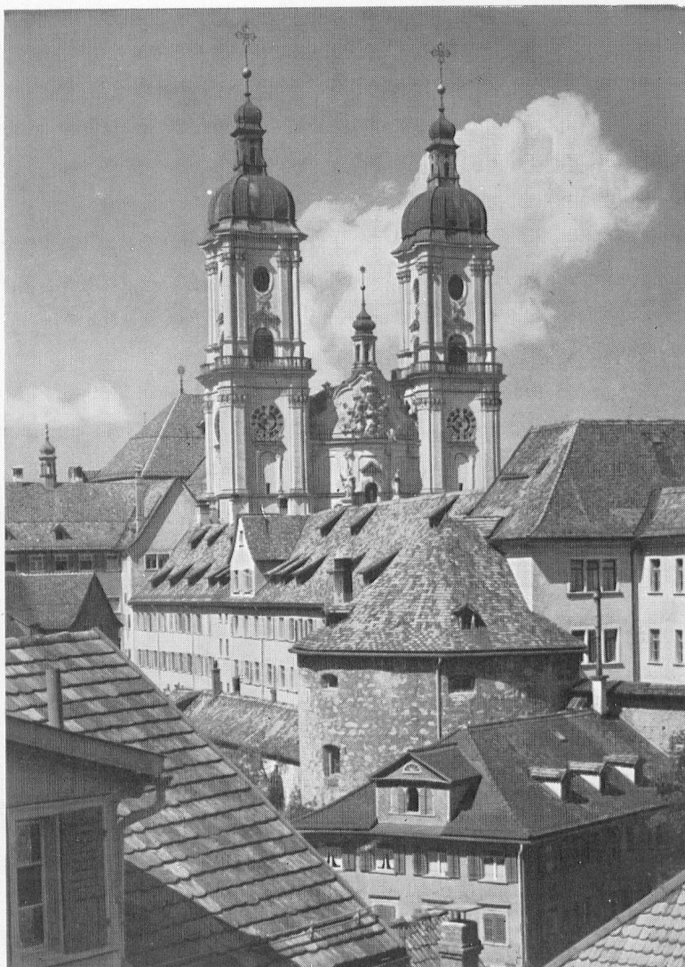
Stiftskirche St. Gallen

Redaktion und Administration: Schweizer-Verein im Fürstentum Liechtenstein, Postfach, Vaduz