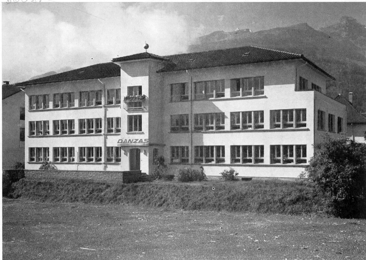
Danzas AG, Hauptgebäude, Buchs SG