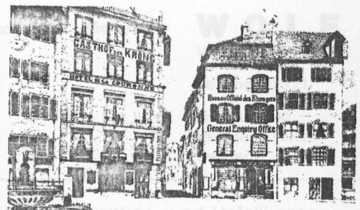
In Basel seit 1855.