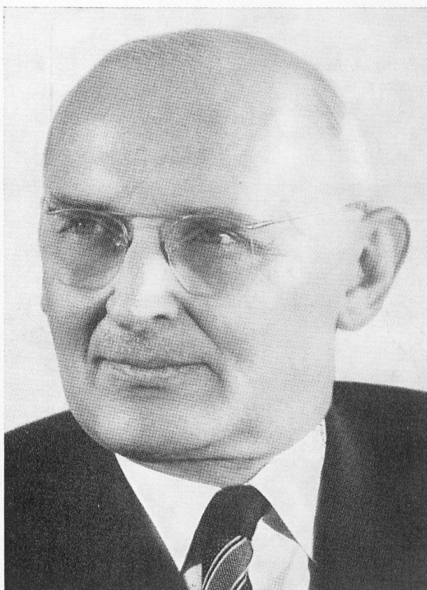
a. Bundesrat Prof. Dr. F. T. Wahlen