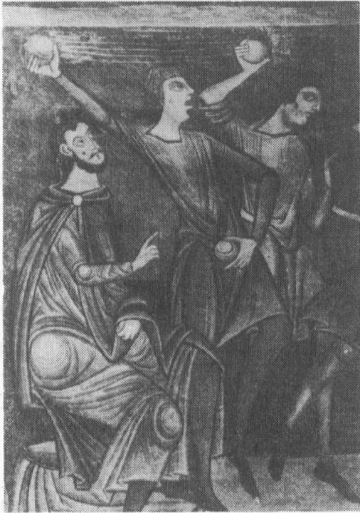
Romanische Malereien in der Klosterkirche von Münster

Das schweizerische Recht kommt nur zur Anwendung, wenn das ausländische Wohnsitzrecht nicht anwendbar ist. Eine Ausnahme besteht bezüglich der in der Schweiz gelegenen Liegenschaften,