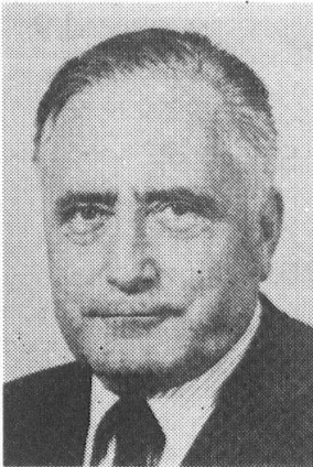
Bundespräsident G.A. Chevallaz

Historischer Geburtstage zu gedenken, ist nicht ganz problemlos. Die Gefahr, die Vergangenheit im Lichte heroischer und ruhmreicher Taten zu würdigen, ist nicht zu übersehen. Sie zeigt sich darin, dass wir uns mit einer weit zurückliegenden Vergangenheit zudecken und uns ohne grosse Bedenken mit den Vorfahren identifizieren, dabei aber die Gegenwart und die Probleme, die uns diese aufgibt, übergehen.