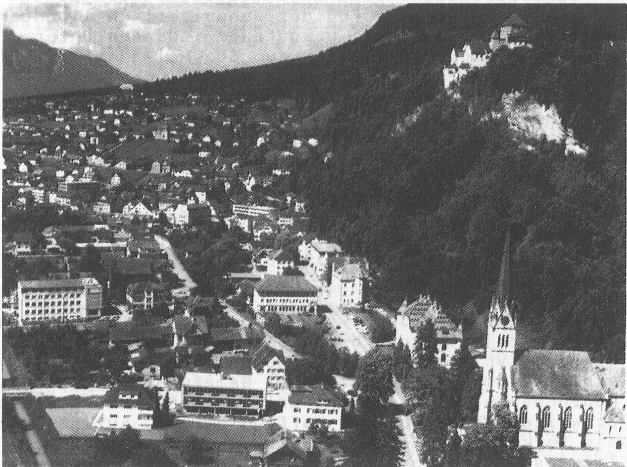
Vaduz - Hauptort des Fürstentums

Indem ich meine Landtagsrede beendige, will ich Gott inständig bitten, er möge, sehr geehrte Herren Abgeordnete, ihre Arbeit segnen, damit sie wohlgetan sei und Früchte trage."