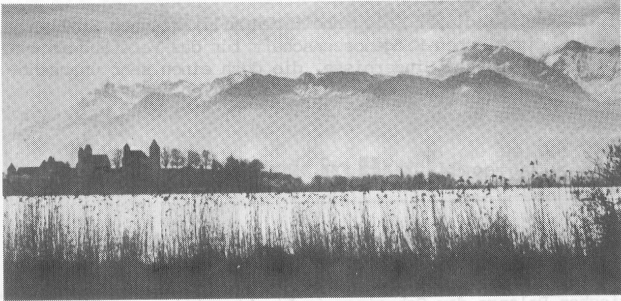
Herbststimmung am Zürichsee

Kann und muss aus den Worten des Militärwissenschaftler und Divisionärs Stutz der Schluss gezogen werden, dass St.Luziensteig als Festungsanlage wohl bald ganz ausgedient haben wird? Nicht zutreffen wird sein Verdikt für den Waffenplatz, auf den die Schweizer Armee heute mehr denn je angewiesen sein wird.