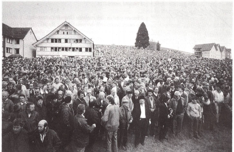
Historische Landsgemeinde von Hundwil (Appenzell-Ausser rhoden) vom 30. April 1989: Frauen endlich gleichberechtigt.