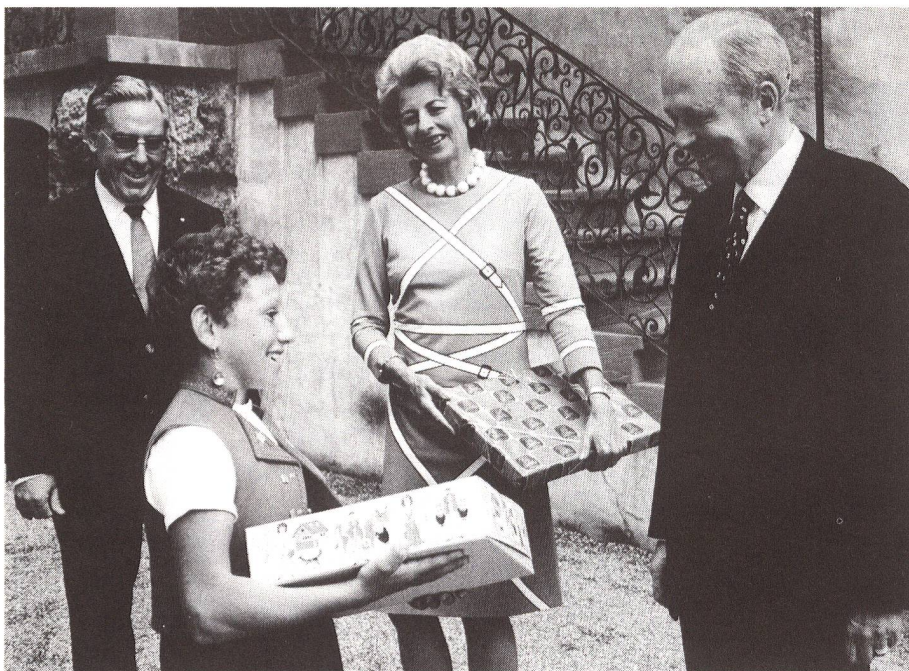
Empfang im Schloss Vaduz anlässlich der 1. August-Feier im Jahr 1974

Zusammen mit Ihrer Familie und dem Liechtensteiner Volk trauern wir um einen wahren Fürsten und einen grossen Menschen.