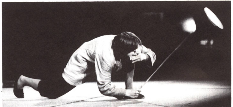
Der weltberühmte Clown Dimitri in Aktion.

aus dem Nichts entstanden, jenes von Locarno (Bild) aus einem wertvollen Nachlass, der während Jahren in einem feuchten Schloss seinem Schicksal überlassen war.