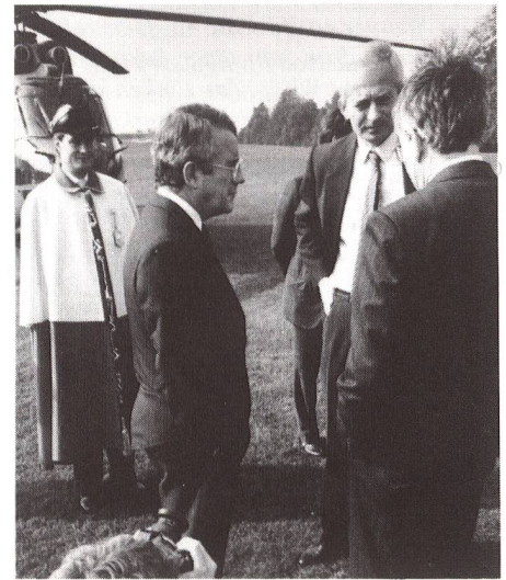
Bundespräsident Arnold Koller und Seine Durchlaucht Fürst Hans-Adam II. im Gespräch mit Bundesrat Kaspar Villiger (v.l.n.r.)

Anlässlich des Mittagessens, offeriert von Bundespräsident Arnold Koller und Frau Koller, verwies der Bundespräsident in seiner Tischrede auf seine Ueberzeugung, dass ein einiges Europa ein föderalistisches Europa sein könne, und dass Liech-