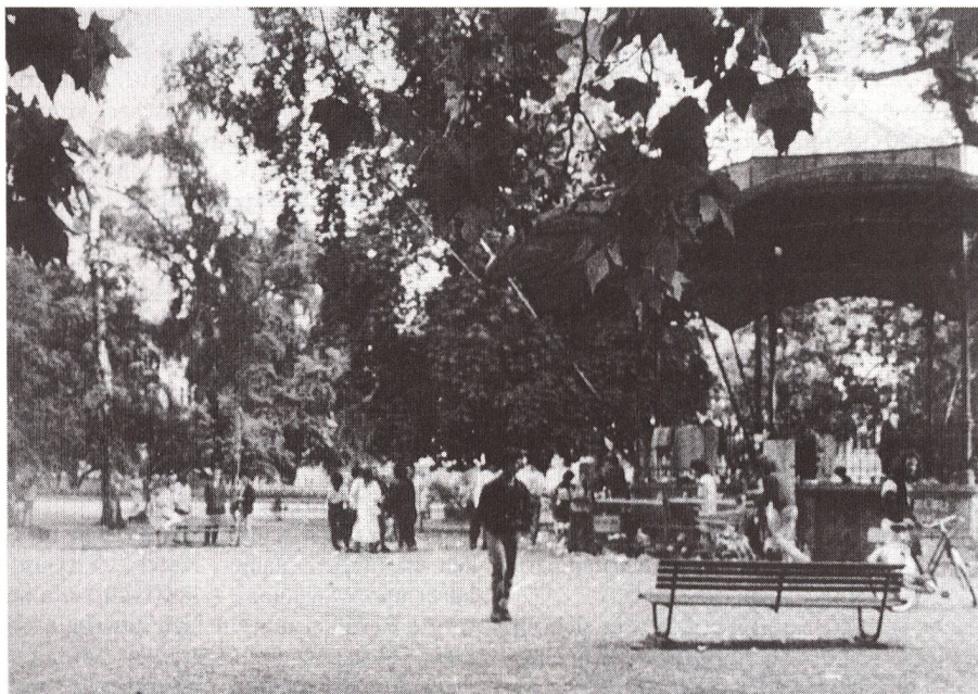
Die aktuelle Zürcher Drogenszene am Platzspitz.