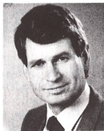
Minister Rolf Bodenmüller, Chef des Auslandschweizerdienstes, EDA

die Zustimmung erhält – das grösste vom Bund je in Angriff genommene Werk. Es verlangt viel Mut, Risiko – und Opferbereitschaft. Auch unser Land würde natürlich von diesem Vorhaben enorm profitieren: Die Verbindungen zu Europa würden kürzer und schneller, die Kontaktmöglichkeiten häufiger und intensiver. Damit könnten wir teilhaben an diesem einmaligen Prozess des europäischen Zueinanderrückens, dem wir uns auf keinen Fall entziehen können. Mit seiner NEAT-Botschaft – so meine ich – hat der Bundesrat viel Weitblick für die Zukunft Europas bewiesen – also genau das Gegenteil von dem, was man ihm zuweilen vorwirft. Es liegt nun am Ständerat, am Nationalrat und vielleicht auch an den Stimmbürgern, die bösen Zungen, welche uns gerne helvetischen Egoismus und eine Igelmentalität vorwerfen, Lügen zu strafen.