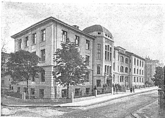
Handelshochschule St. Gallen

Der Besuch der kaufmännischen Fortbildungsschulen für Lehrlinge ist an den meisten Orten auf Grund kantonaler Gesetze obligatorisch. Indessen war er schon vor