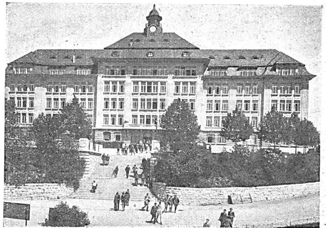
Höhere Handelsschule Lausanne