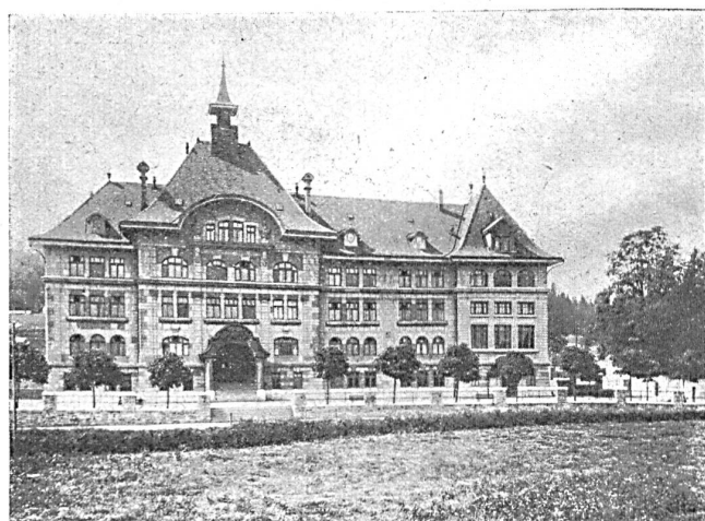
Höhere Handelsschule La Chaux-de-Fonds