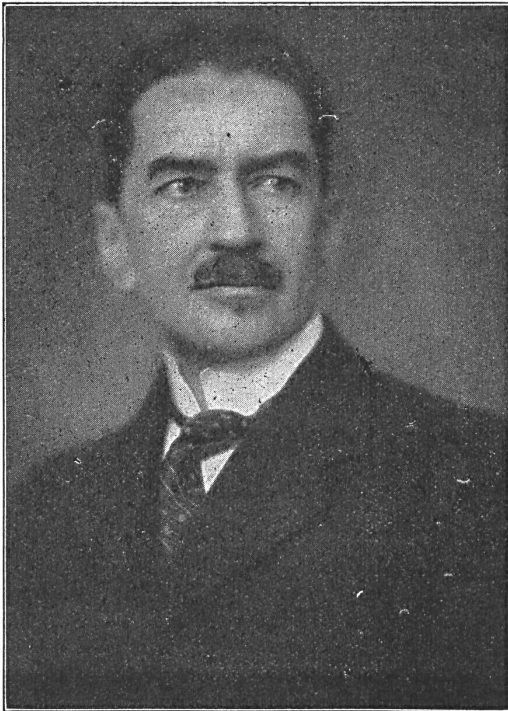
Prof. Dr. Hans von Euler-Chelpin

der Träger des diesjährigen Nobelpreises für Physik. Seine Forschungen über die Natur der Wellen beseitigten die scheinbar unüberbrückbaren Gegensätze der beiden bisherigen Licht-Theorien.