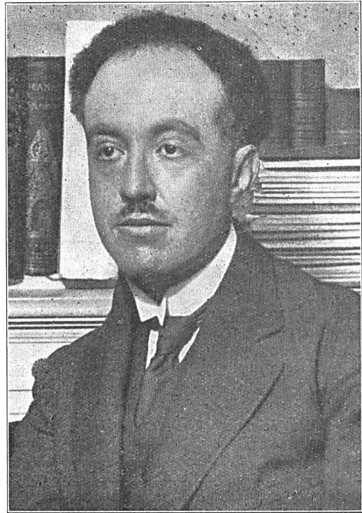
Herzog Louis Victor de Broglie

Professor der Biochemie an der Universität London, erhielt die Hälfte des diesjährigen Nobelpreises für Chemie für seine Forschungen über die Gärung der Zuckerarten.