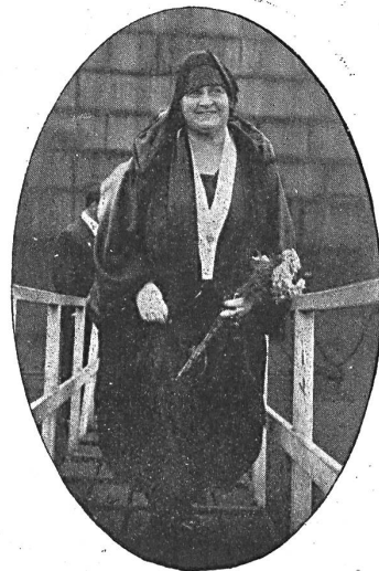
Dr. Maria Montessori