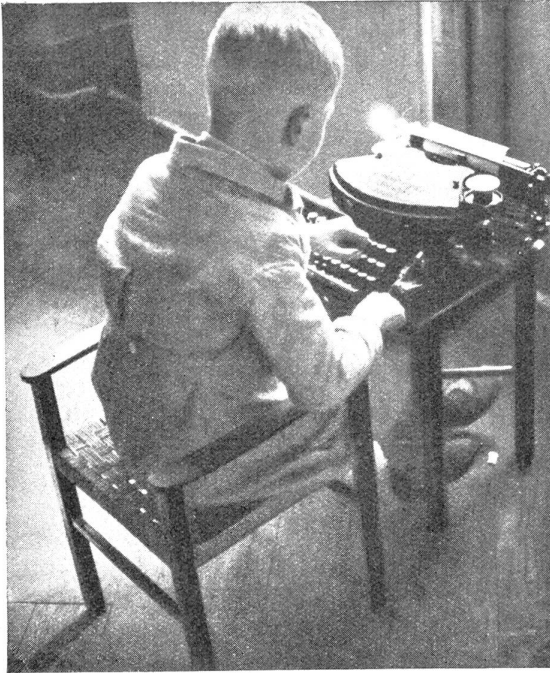
Arbeit an der Schreibmaschine