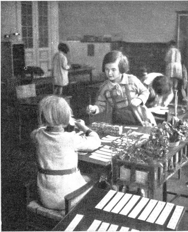
Ein Rechenspiel zur Erlernung der Multiplikation mehrstelliger Zahlen