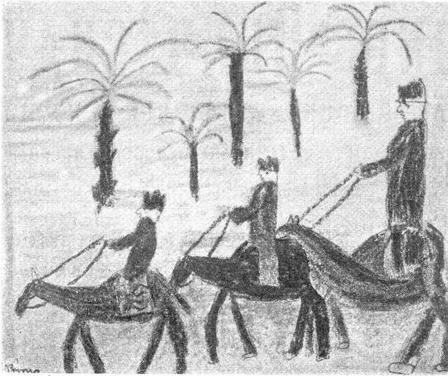
Die Heiligen Drei Könige (Farbstiftzeichnung aus einer zweiten Klasse – Chur)

Das Kennzeichen der ganz großen Menschen liegt darin, daß wir ihre Weisheit nie ganz auszuschöpfen vermögen, daß wir nie damit fertig werden, bei ihnen zu lernen. Zu diesen ganz großen Geistern gehört Heinrich Pestalozzi . Er hat uns gelehrt, worauf es bei allem Beistand unseren Nächsten gegenüber letzten Endes ankommen muß. Sein ganzes Lebenswerk ist ein großes Zeugnis für diese Forderung. Du sollst den notleidenden Menschen helfen, sich selbst helfen zu können . Auf diesem Grundsatz beruhte all sein hingebungsvolles Bemühen. Auch alle Erziehung am Andern kann nach Pestalozzi nur den Sinn haben, seiner Selbsterziehung und seiner Selbständigkeit den Weg zu bereiten.