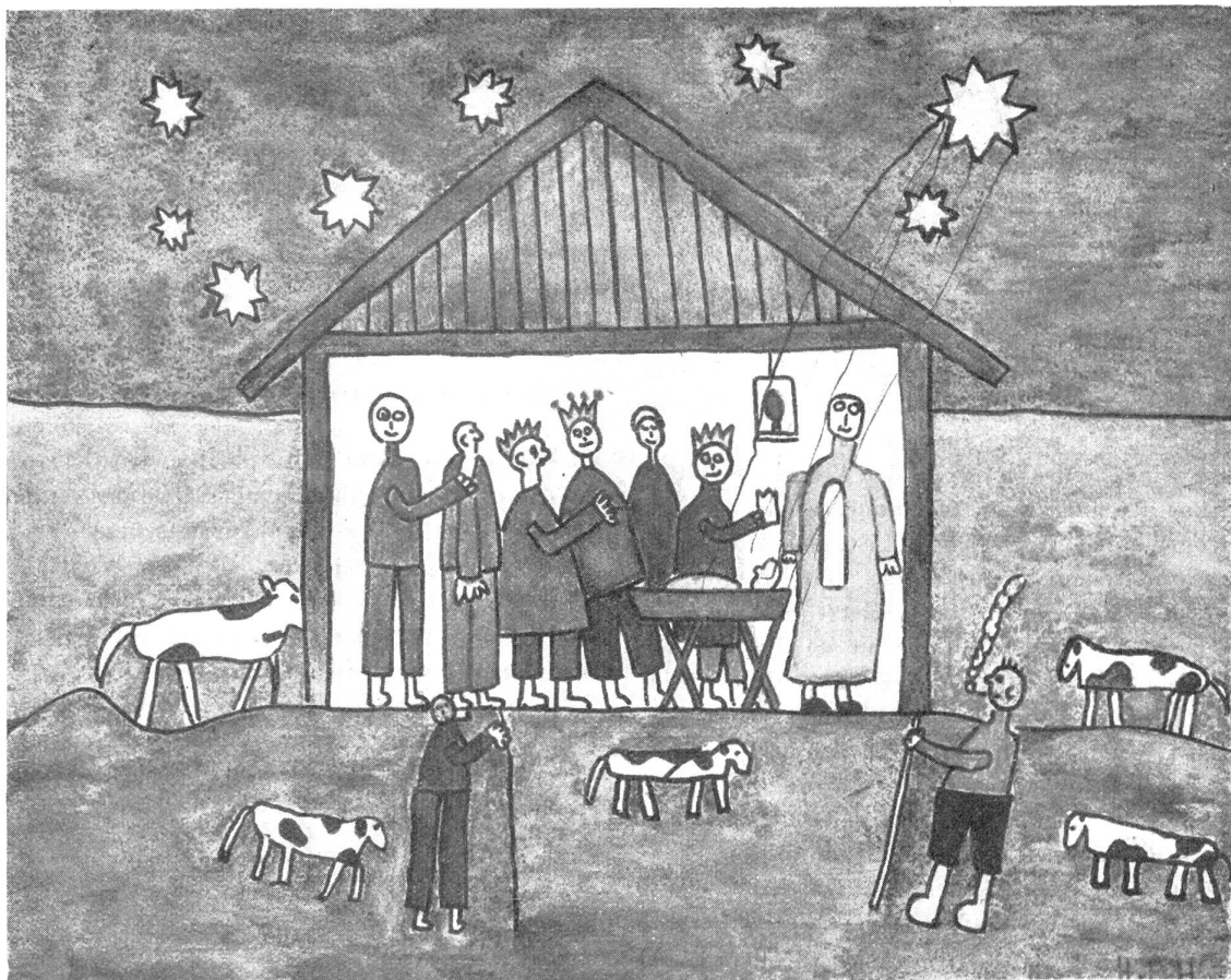
Im Stall zu Bethlehem (Aquarell mit Tuschelinien aus einer zweiten Klasse – Arosa)