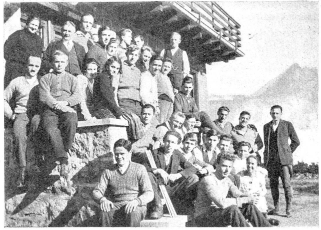
Volksbildungskurs in Filzbach