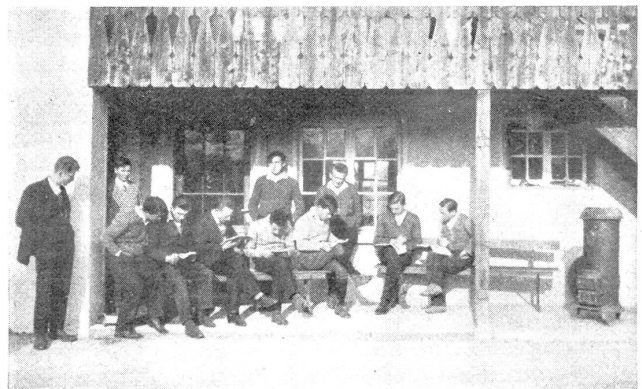
Jungmännerkurs in Gwatt

wo sie einige Stunden des Tages den Boden bebauen und dadurch wieder in ein natürliches Verhältnis zur körperlichen Arbeit kommen können.“