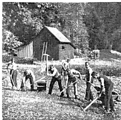
Ausbesserung eines Erdschliffes bei Einsiedeln