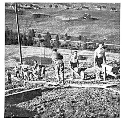
Junge Arbeitslose räumen im Unwettergebiet. Freiwilliger Arbeitsdienst der Schweiz, evangelischen Jugendkonferenz