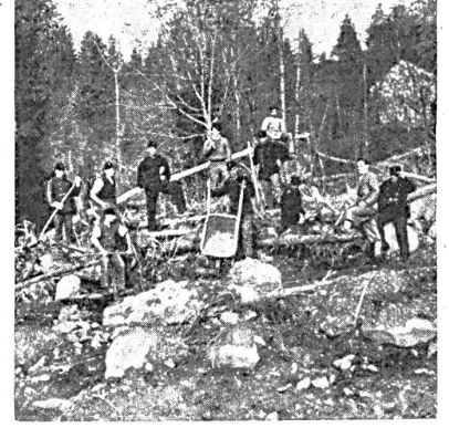
Beginn der Räumung (Unwetterschäden) am Aegerisee

Staate vermittelt wird. Wenn sich auch die Ziele des „freiwilligen“ Dienstes nur viel schwieriger und langsamer erreichen lassen, so dürfen doch nur Wege beschritten werden, die die Arbeitsfreude und das Verständnis für die inneren Werte der Arbeit wecken und stärken. Unsere Jugendlichen werden sich nur durch einen freien Entschluß von der Bedrücktheit eines arbeitslosen Daseins befreien, und so als wertvolle Mitglieder unserer Volksgemeinschaft fühlen können.