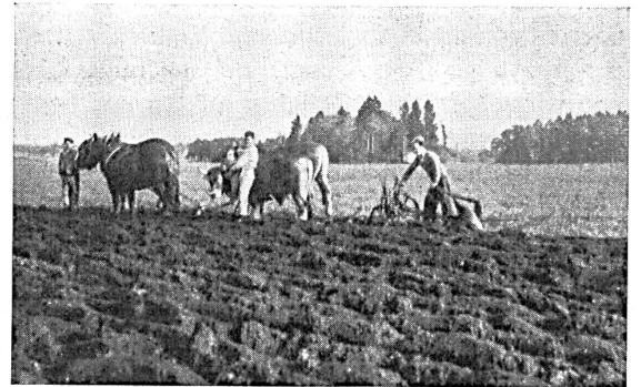
Einführung arbeitsloser Jugend in landwirtschaftliche Arbeiten. Freiwilliges Arbeitslager Elektrohof des Jugendamtes des Kantons Zürich

Der freiwillige Arbeitsdienst fördert das Verständnis unter den verschiedenen Volksgruppen und entspricht den demokratischen Grundlagen unseres Staates; er bindet zugleich die Jugend an selbstgeschaffene, heimatliche Werte. Möge sich seine tiefere Begründung zum Schutze des geistigen Wohles unserer Jugend in immer stärkerem Maße durchsetzen.