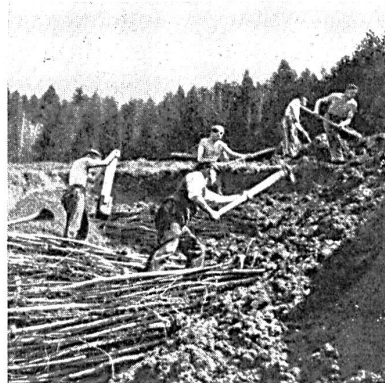
Planierung im Zürcher Oberland