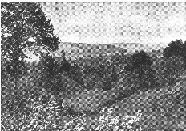
Bad Hersfeld, Gesamtansicht