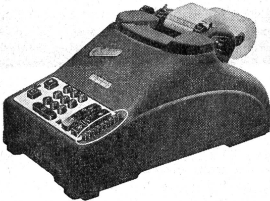
Elektrische Standardmodelle von Fr. 1300.— an.

Multipliziert vollautomatisch, rechnet geräuschlos und blitzartig!