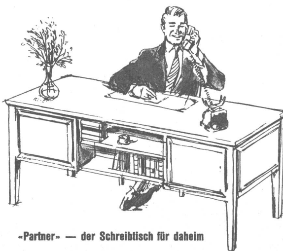
-Partner- — der Schreibtisch für daheim

Unfall-, Haftpflicht-, Kasko-, Feuer-, Glas-, Wasserleitungsschaden-, Einbruch-Diebstahl-, Reisegepäck- und Transport-Versicherungen.