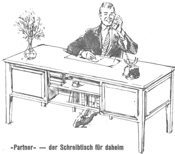
«Partner» — der Schreibtisch für daheim

Damen- Mode — Konfektion St. Leonhardsstr. 8-10 u. Marktplatz 22 Telefon (071) 22 27 01