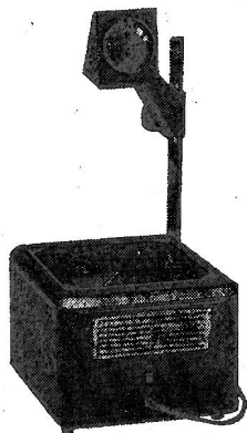
Porta-Scribe Standard 600 Watt, 8,2 kg Schulpreis Fr. 1100.—