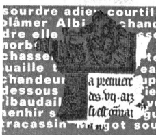
TABLEAU DE LA LANGUE FRANÇAISE