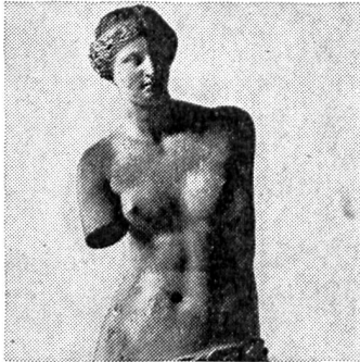
Venus von Milo, unbekannte Schönheit aus Milet. Alter etwa 2100 Jahre.

Araldit ist eines der fortschrittlichsten Bindemittel unserer Zeit.