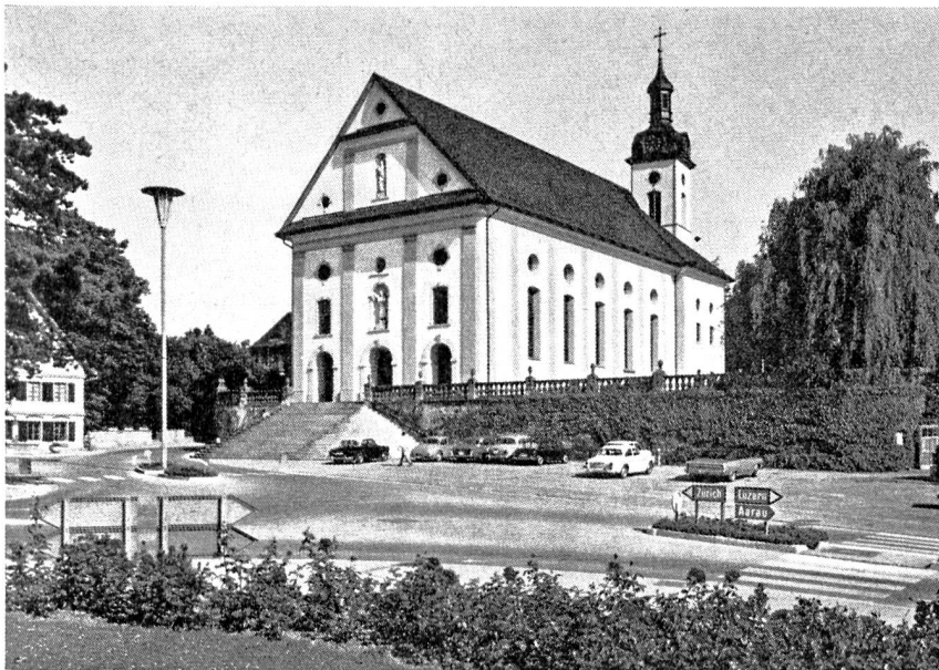
Das Wahrzeichen von Wohlen ist die Pfarrkirche St. Leonhard