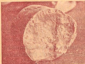
In feinen Poren lagert das Erdgas im Gestein (Pfullendorf)

Unterkunft: Vollpension pro Tag ca. Fr. 38.—.