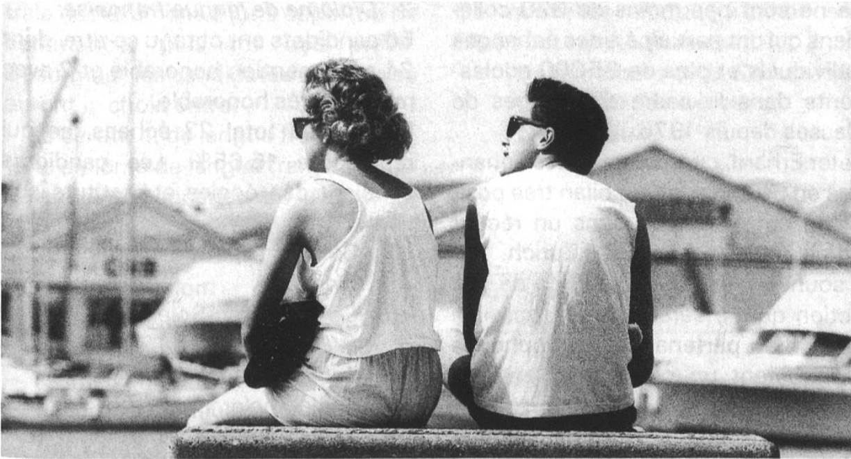
Jugendaustausch schafft direkte Kontakte

aktivieren, hänge nicht zuletzt von der Haltung der Deutschschweizer gegenüber den Romands ab. Von Bedeutung dürfte dabei sein, die Schwierigkeit der vielen Dialekte bei Kontakten mit anderssprachigen Schweizern – auch in der Schule – durch die Verwendung der deutschen Standardsprache zu überwinden. K.