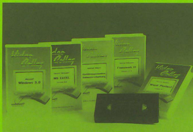
Video Colleg – die Softwareschulung auf Video

Sie darf in keinem modernen Betrieb fehlen! Denn mit Video Colleg können Sie erhebliche Kosten einsparen