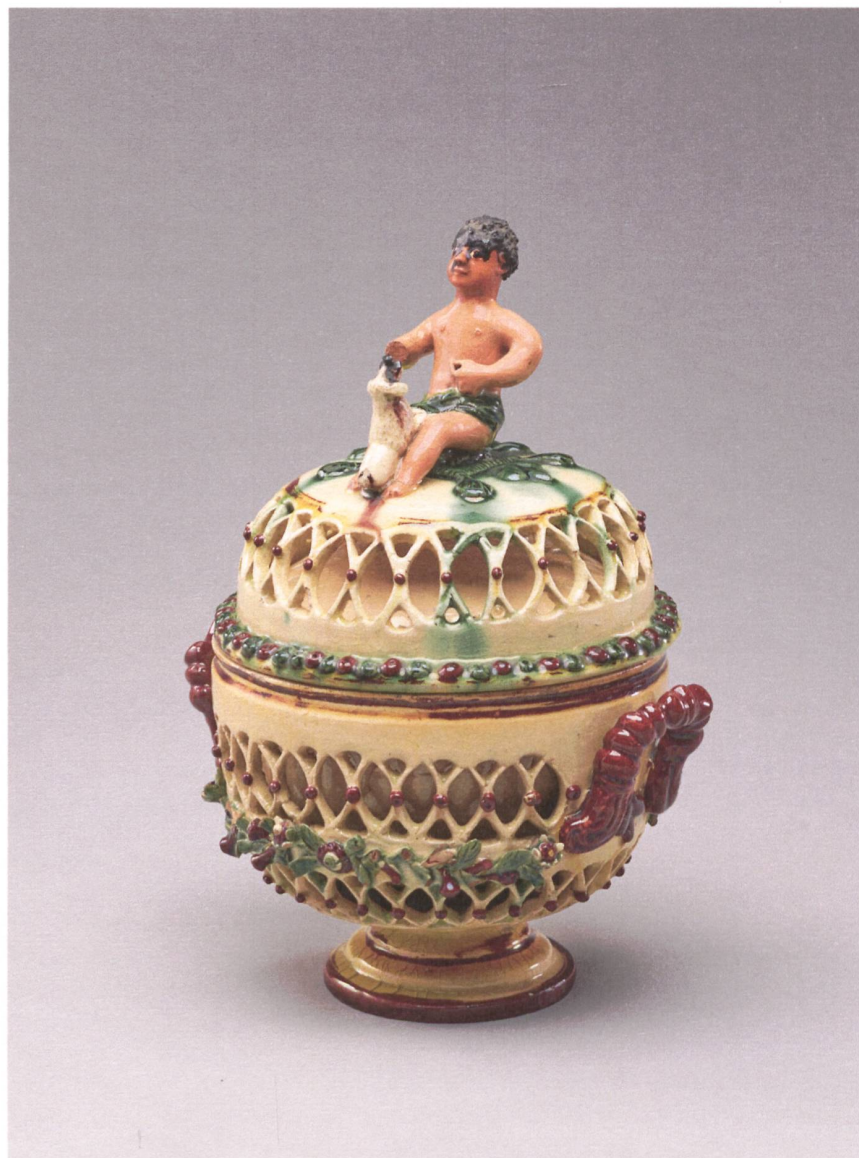
Abb. 1 Deckelterrinen mit pflanzlichen Motiven. Der Deckelknopf bildet eine rassifizierte und stereotypisierte Figur mit Hund. Herstellung: wohl Bern (Kanton). Um 1800–1900. 21 cm, engobiert, bemalt. SNM, LM 50469.