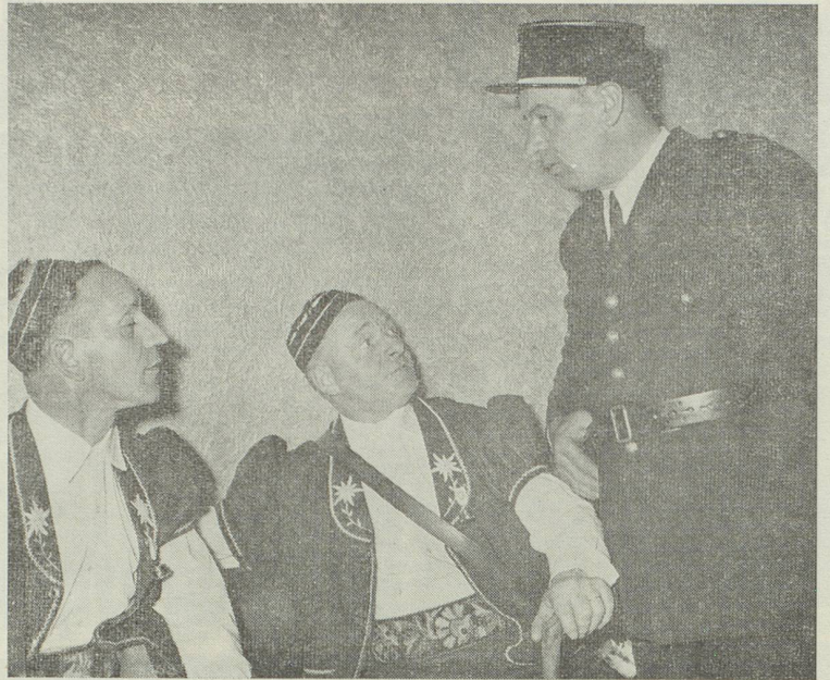
Deux armaillis gruériens écoutent, intéressés, les conseils d'un agent parisien.