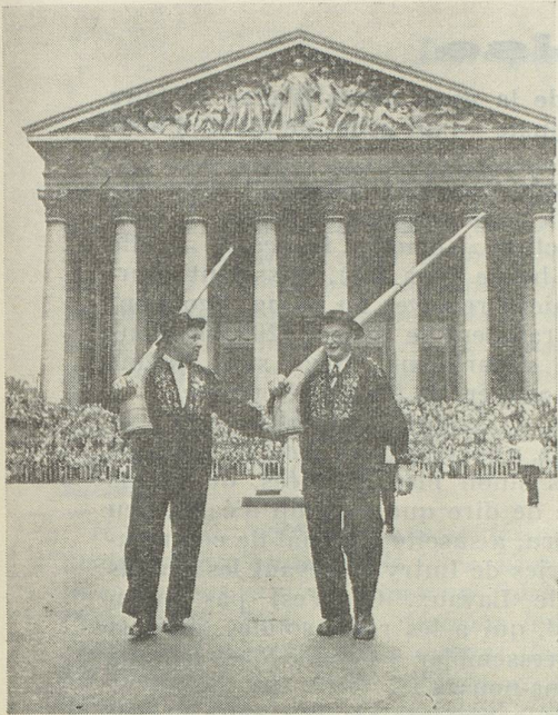
Devant la Madeleine les sonneurs de cor des alpes.