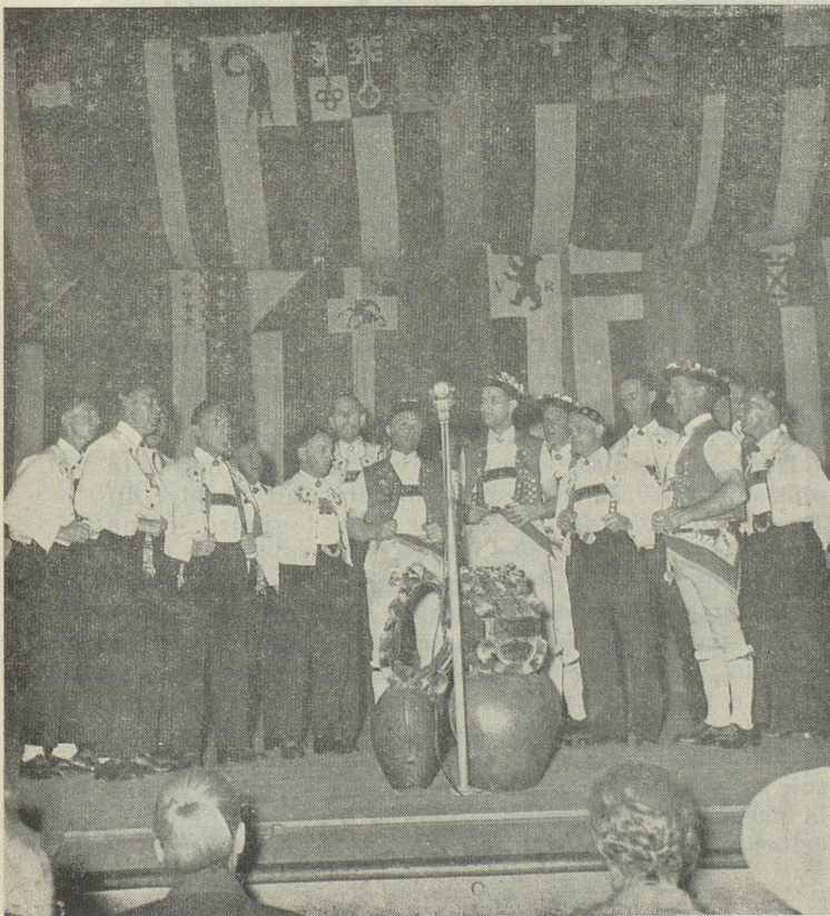
Et voici les armaillis des montagnes d'Appenzell