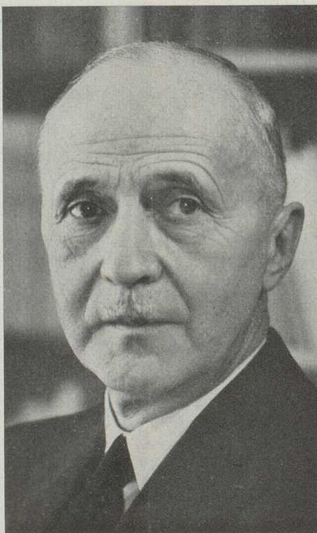
↑ CONSEILLER FÉDÉRAL PHILIPP ETTER

Né le 21 mai 1897 à Thoune. Originaire de Glaris et Berne. Gymnase libre et études de droit à Berne. 1921, avocat. 1924, docteur en droit. De 1921 à 1922, secrétaire du Parti bourgeois de la ville de Berne. De 1922 à 1928, rédacteur, puis de 1928 à 1945, rédacteur en chef de la « Neue Berner Zeitung ». De 1933 à 1935, président central de la Fédération de la presse suisse, dont il est membre d'honneur depuis 1944. De 1935 à 1945 et de 1947 à 1951, conseiller national. De 1945 à 1951, membre du Conseil exécutif du canton de Berne, de 1945 à 1946, directeur des affaires communales et sanitaires, de 1946 à 1951, directeur de l'Instruction publique et des cultes. Président du gouvernement pour 1947/1948. Depuis 1951, bourgeois d'honneur de Berne. Le 13 décembre 1951, l'Assemblée fédérale l'élit membre du Conseil fédéral, en remplacement de M. Ed. de Steiger, démissionnaire. 1956, Président de la Confédération.