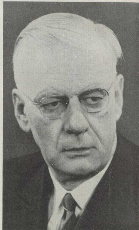
← CONSEILLER FÉDÉRAL MARKUS FELDMANN

Né le 7 février 1896, originaire de Bütschwil (St-Gall). Etudes de droit de 1915 à 1920 à Bâle, Genève, Berne et Rome, docteur en droit en 1920. Pratique le barreau dès 1920 à St-Gall. Membre du Conseil de l'Ecole des hautes-études commerciales de St-Gall. Président de la Commission fédérale des banques de 1951 à 1954. Député au Grand Conseil du canton de St-Gall de 1936 à 1954. Député au Conseil national de 1937 à 1954 (président pour 1952/53). Au militaire : Colonel de l'Etat-Major général. Le 16 décembre 1954, l'Assemblée fédérale l'élit Conseiller fédéral en remplacement du Conseiller fédéral Rubattel, démissionnaire.