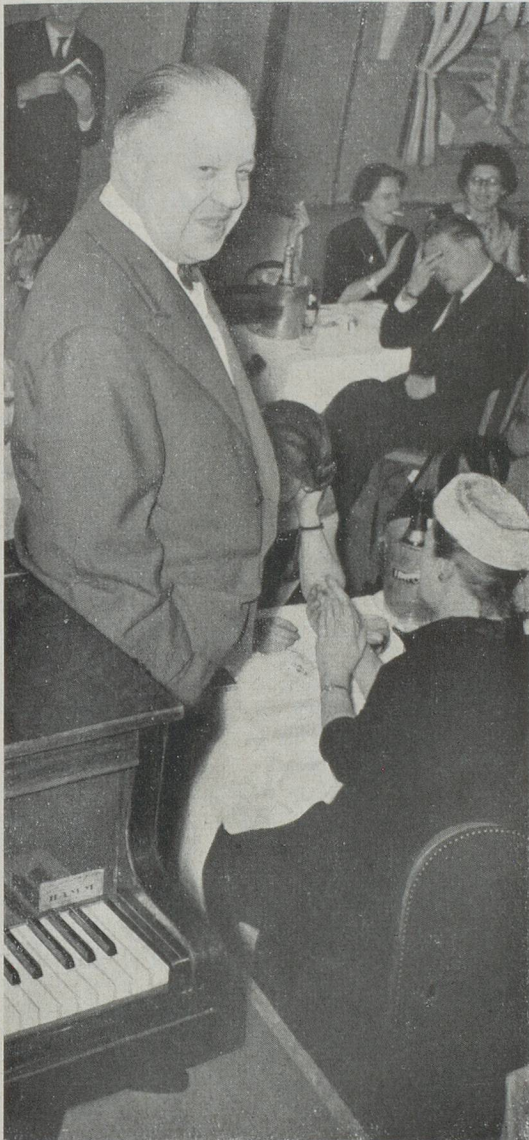
La fin d'une bonne histoire vaudoise, au cabaret « Chez Gilles », à Paris.