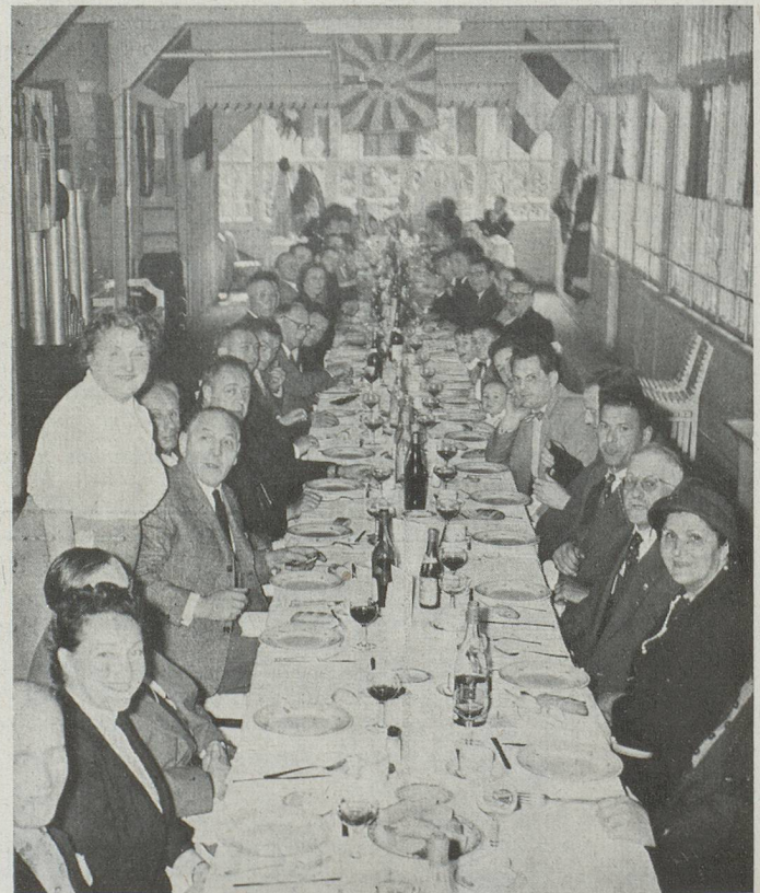
Déjeuner amical du CERCLE SUISSE ROMAND 15 septembre 1957