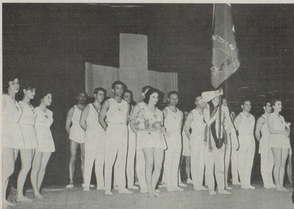
Le salut au drapeau des gymnastes

La magnifique Salle des Fêtes de la Cité universitaire avait mis, cette année encore, son cadre ravissant au service de la rencontre de près d'un millier de compatriotes venus de tous les coins de Paris et de sa banlieue.