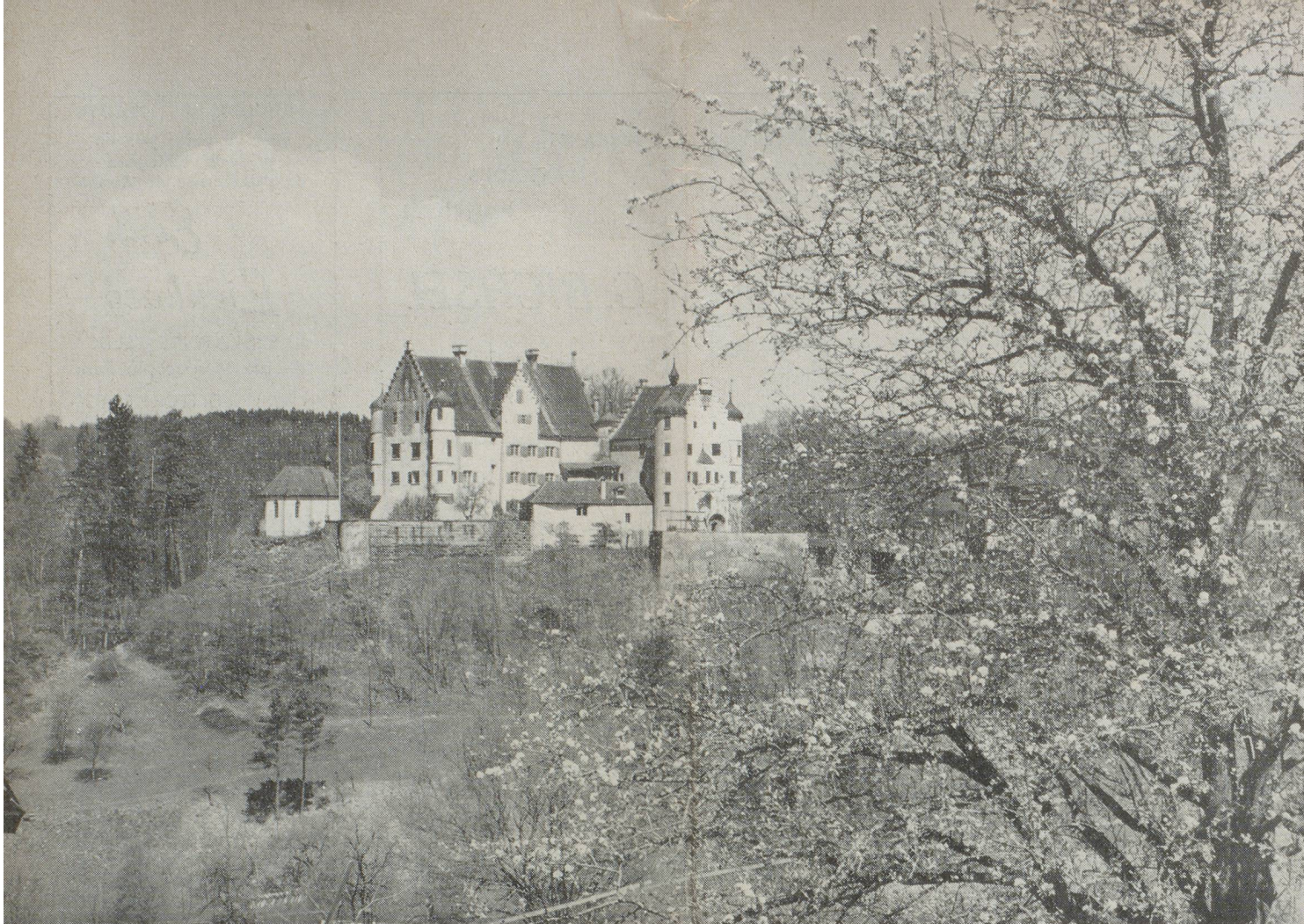
Château Altenklingen près de Märstetten/Thourgovie