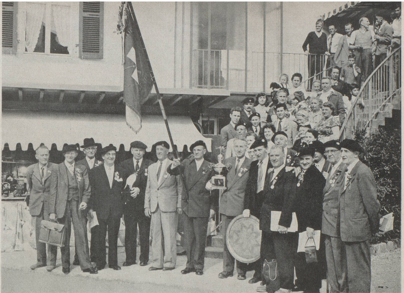
C'est la troisième fois que les tireurs suisses de Paris remportent la première place parmi les tireurs suisses de l'Étranger à un tir fédéral. Voici la fameuse équipe des 22 participants parisiens avec leurs femmes, enfants et amis après la distribution des prix à Douanne