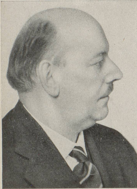
M. Jean Studer, Consul général du Consulat de Suisse à Strasbourg

Né à Neuchâtel, le 9 mars 1908. Après avoir obtenu la maturité commerciale de l'Ecole Supérieure de Commerce de Neuchâtel, est entré au service du Département Politique fédéral en mars 1928.