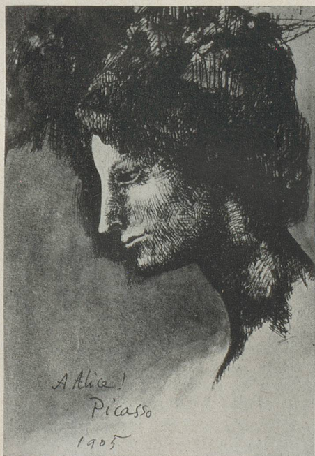
PICASSO - Alicia. Coll. particulière