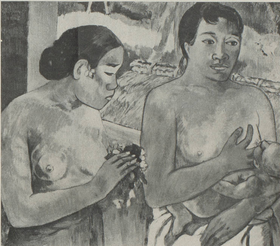
GAUGUIN - L'offrande. Coll. Burhle, Zurich

Ajoutons que la plupart des amateurs suisses, se sentant responsables