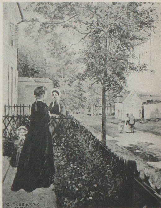
PISSARRO - La route de Versailles à Louveciennes Coll. Bühler, Zurich

aux autorités, tant françaises que suisses, qui nous ont conseillés et aidés.