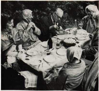
Un déjeuner non pas sur l'herbe mais sous la pluie