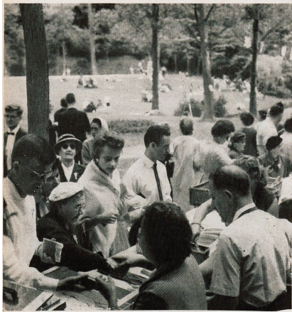
Si le temps se gâta l'après-midi, le matin fut tout de même ensoleillé et nombreux furent les pique-niqueurs venant se ravitailler au buffet Ungemuth