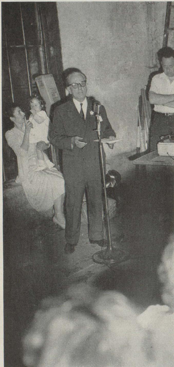
C'est dans le petit théâtre de Montcel que S.E. l'Ambassadeur de Suisse prononça le discours que vous lirez ci-contre